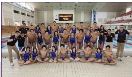
* 企業チームやクラブチームを応援します！

社会人スポーツの振興に寄与することを目的とし、社会人スポーツ推進企業の認定や強化支援事業の実施、優秀選手等の確保に取り組んでいます。